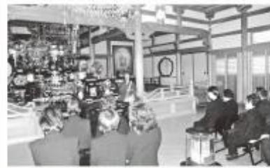
●ご法事や各種の行事・おさらいに...

一方、お寺の本堂で行われる各家のご法事は手軽であり、充実感もあって合理性の上で時代のニーズにあって、本堂の活用はますます多い傾向となっております。